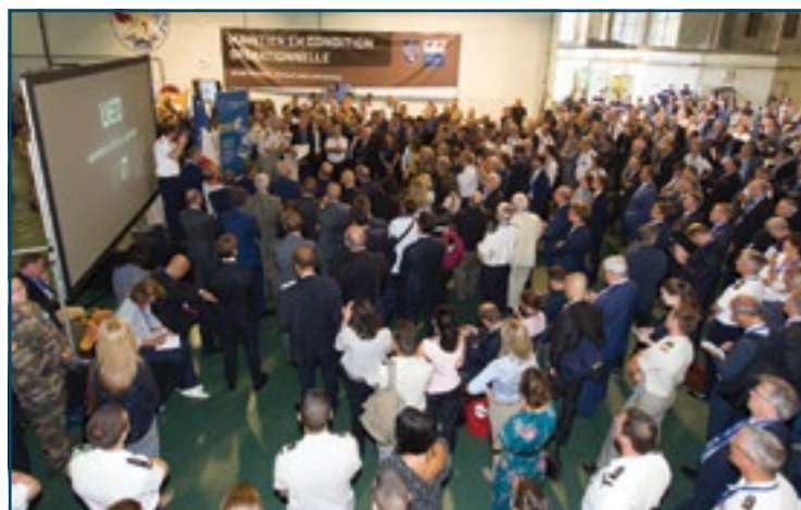
Allocution du Chef d'état-major des armées, le Général d'armée François Lecointre