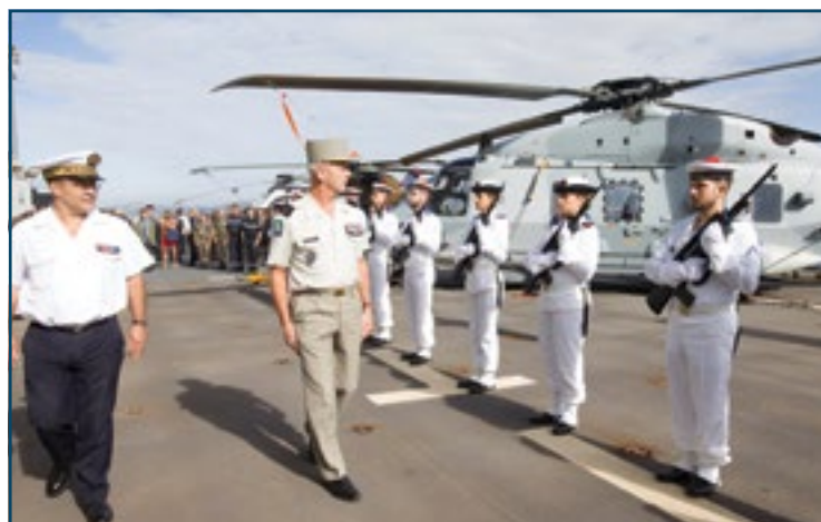
Arrivée du Chef d'état-major des armées, le Général d'armée François Lecointre