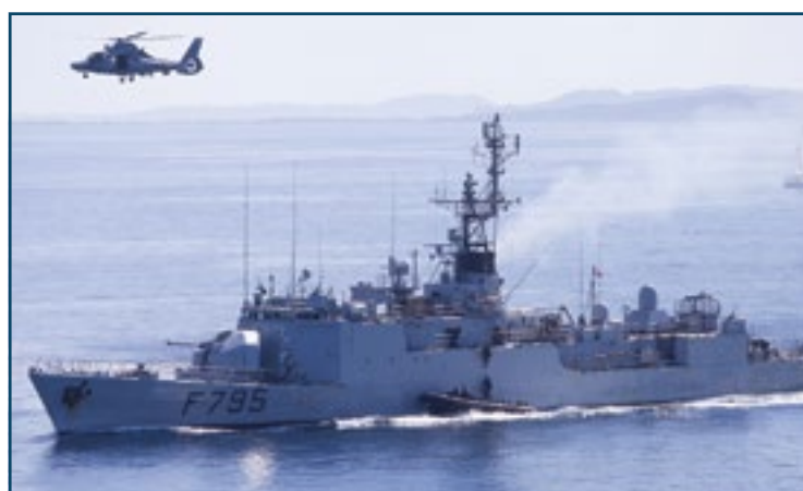
Présentations dynamiques des armées depuis le pont d'envol