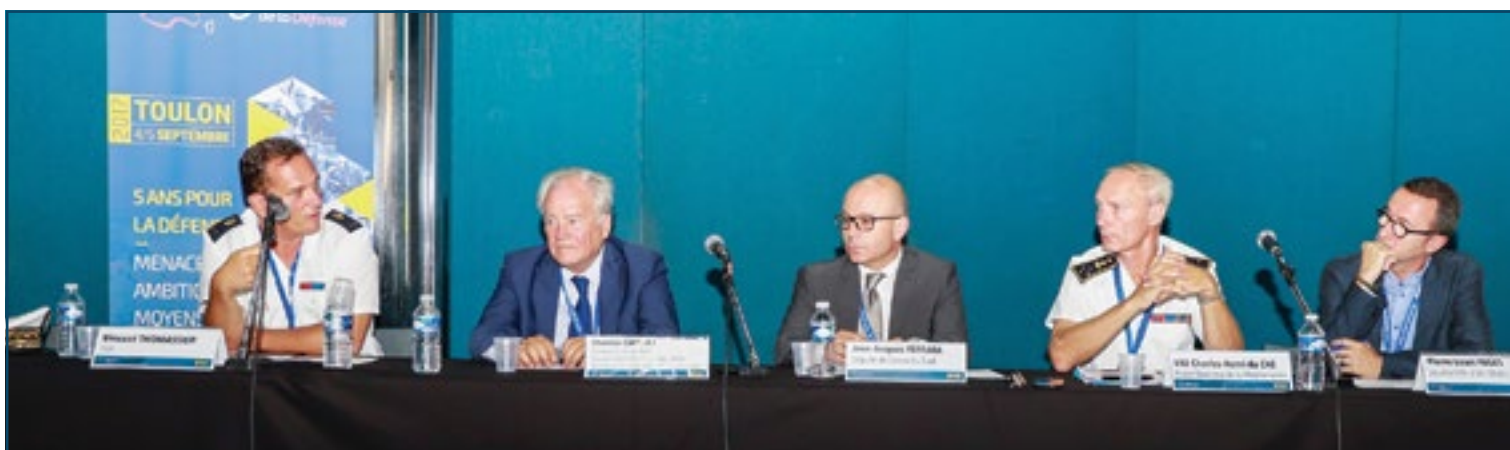
Panel d'intervenants d'un des dix ateliers au Palais Neptune