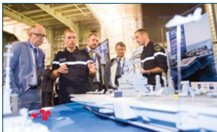
Présentations statiques des armées dans le Hangar Aviation