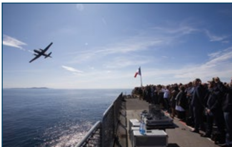
Présentations dynamiques des armées depuis le pont d'envol