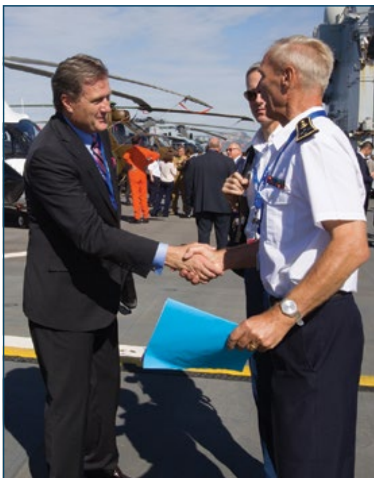
Accueil du Représentant (Républicain) de l'Ohio Michael Turner, membre de la Commission des Forces armées de la Chambre des Représentants des États-Unis par le Préfet maritime de la Méditerranée, l'Amiral Charles-Henri de la Faverie du Ché